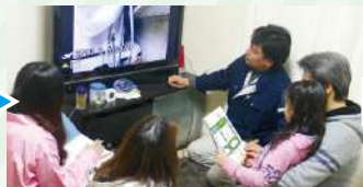
テレビモニターで 床下の状況報告