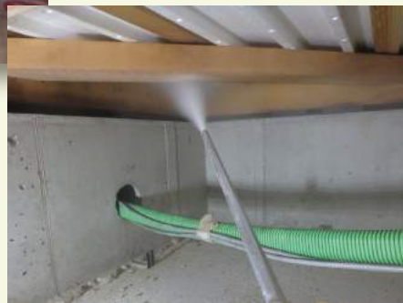
▼床下へのホウ酸ダスティング処理の様子