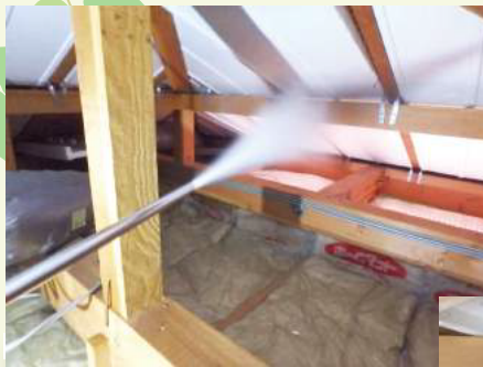
◀小屋裏へのホウ酸ダスティング処理の様子