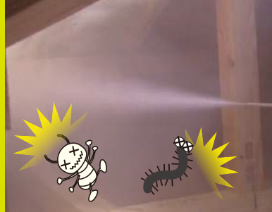
ホウ酸の粉を散粉