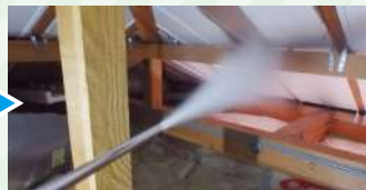
ホウ酸ダスティング 処理工事