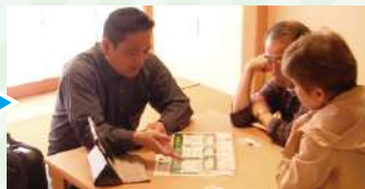
調査報告、工事の方針 をご説明