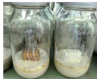
防腐試験 (京大大学生存圏研究所)