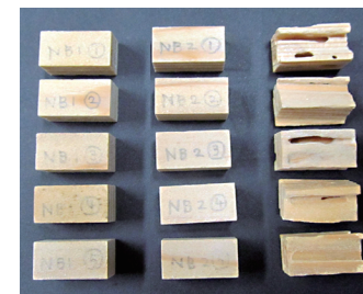
防蟻試験 (京大大学生存圏研究所)

JIS K 1571-2010 附属書 A (規定) 「木材保存剤の性能試験方法及び性能基準」