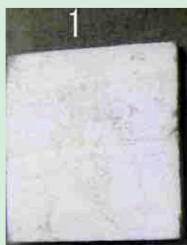
カビ抵抗性試験-木片表面(実期間3年相当経過)